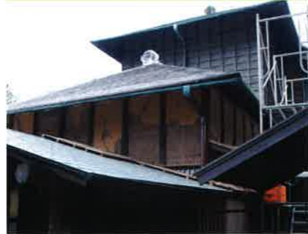
被災時の好文亭の外壁