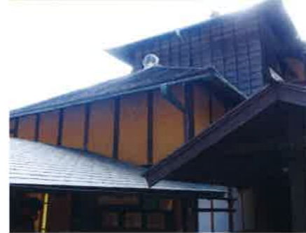
修復された好文亭の外壁