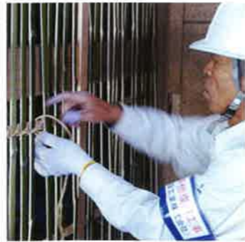
竹小舞の編み作業