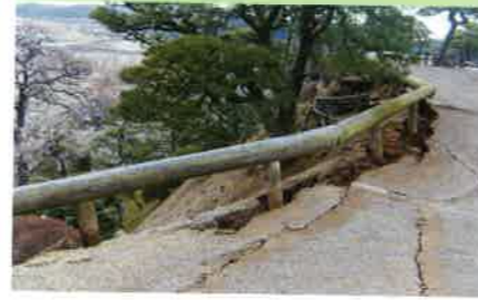
被災時のひびわれ